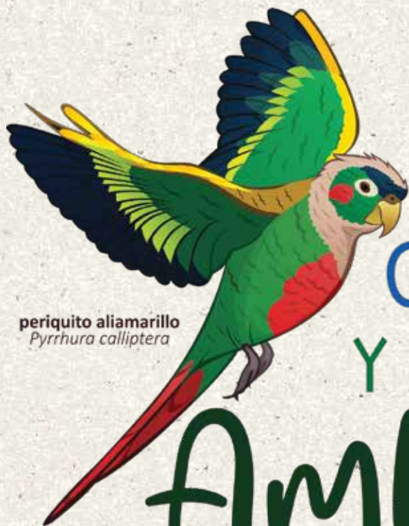
periquito aliamarillo Pyrrhura calliptera